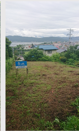
土地の通路を入ったところ