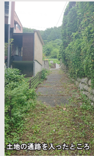
土地の通路を入ったところ