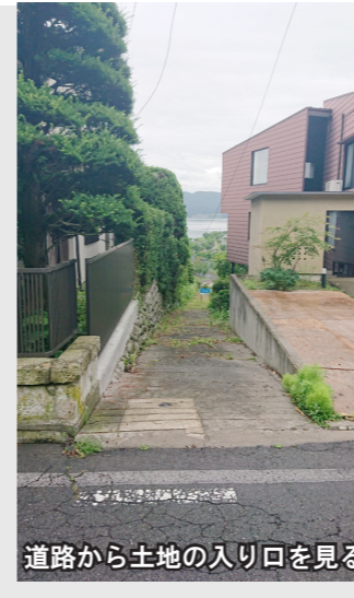
道路から土地の入り口を見る